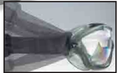
Banda de ajuste giratorio